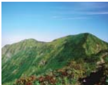
オキノ耳から茂倉岳(左)と一ノ倉岳(右)

なお、この山域には水場がほとんどないので水場のある避難小屋としてたいへん貴重だ。